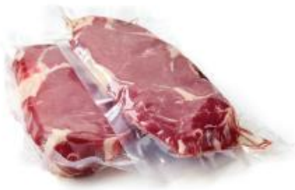
Vakum poşeti ile kapatılmış et

Vakum poşetleri açık hava basıncından faydalanılarak üretilmiştir. Poşet içerisindeki hava alındığında, poşet içerisinde gaz basıncı azalır. Açık hava basıncı, poşete uyguladığı basınç ile poşeti sıkıştırır. Bu sayede poşet içerisinde cisimler normalde kaplayacağından daha az yer kaplar.