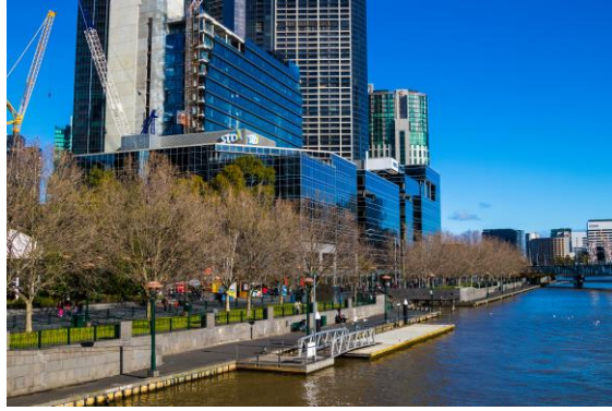
Melbourne – Sonbahar (Güney Yarım Küre)

21 Haziran'da ışınlar Kuzey Yarım Küreye dik gelir. Bu tarihte Kuzey Yarım Küre'de yaz, başlarken Güney Yarım Küre'de kış başlar.