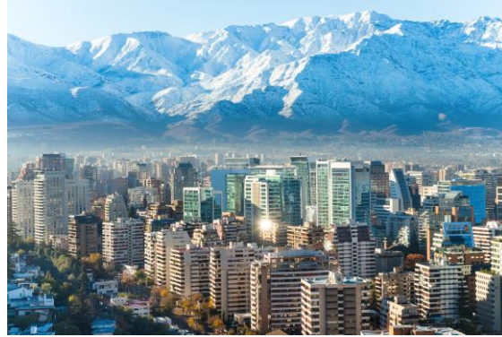
Santiago – Kış (Güney Yarım Küre)