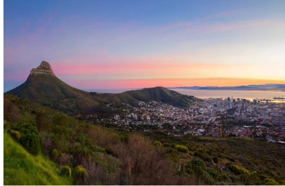
Cape Town – Yaz (Güney Yarımküre)