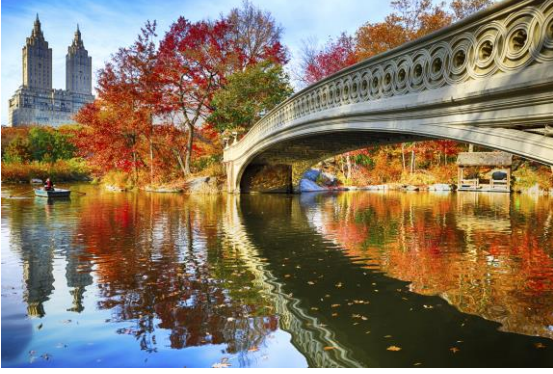
New York – Sonbahar (Kuzey Yarımküre)

23 Eylül'de ışınlar tekrar Ekvator'a dik gelir. Bu tarihte Kuzey Yarımküre'de sonbahar başlarken Güney Yarımküre'de ilkbahar başlar.