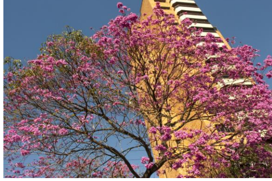
Sao Paulo – İlkbahar (Güney Yarımküre)

Daha sonra ışınlar 21 Aralık'ta Güney Yarımküre'ye dik gelir. Bu tarihte de Güney Yarımküre'de yaz başlarken Kuzey Yarımküre'de kış başlar.