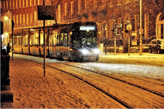
Dublin – Kış (Kuzey Yarımküre)

Daha sonra ışınlar 21 Aralık'ta Güney Yarımküre'ye dik gelir. Bu tarihte de Güney Yarımküre'de yaz başlarken Kuzey Yarımküre'de kış başlar.