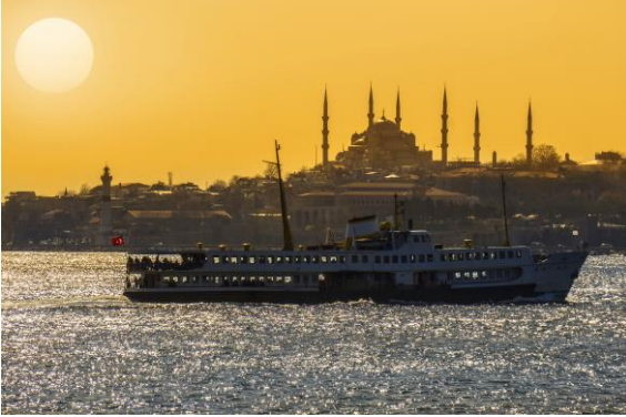
İstanbul – Yaz (Kuzey Yarım Küre)

21 Haziran'da ışınlar Kuzey Yarım Küreye dik gelir. Bu tarihte Kuzey Yarım Küre'de yaz, başlarken Güney Yarım Küre'de kış başlar.