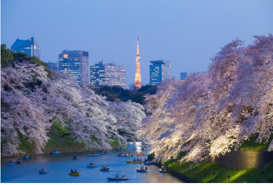
Tokyo – İlkbahar (Kuzey Yarım Küre)

Güneşten gelen ışınlar 21 Mart'ta Ekvator'a dik gelir. Kuzey Yarım Küre'de havalar ısınmaya başlar ve ilkbahar başlarken Güney Yarım Küre'de sonbahar başlar.